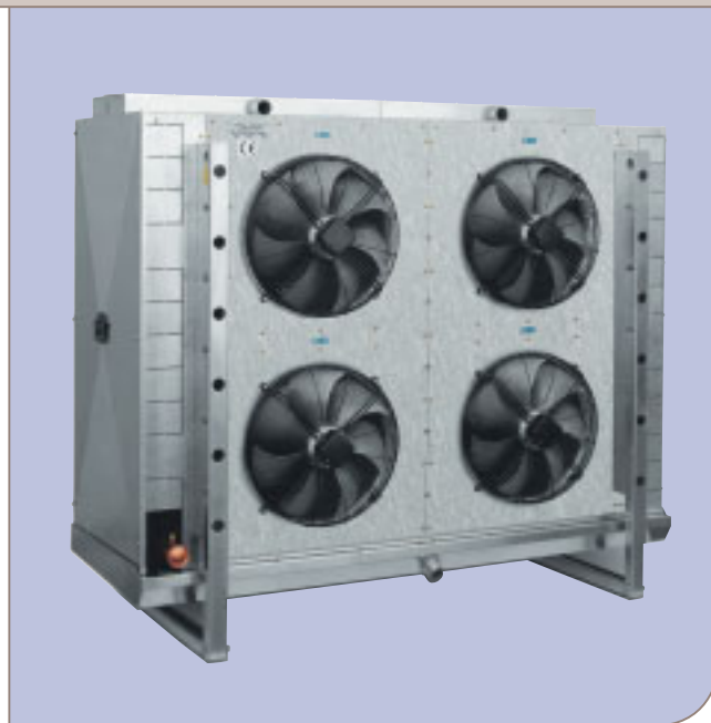
AlfaBlast ABE 502 A7 с водяной системой оттаивания.

Каркас, изготовленный из нержавеющей стали или алюминия, специальные вентиляторы для создания высокого статического давления, разнообразные системы оттаивания (вода, электричество, горячий газ) и защитное покрытие змеевика (катафорезное, термо-защита, эпоксидное покрытие), а также предварительно покрытие ребер.